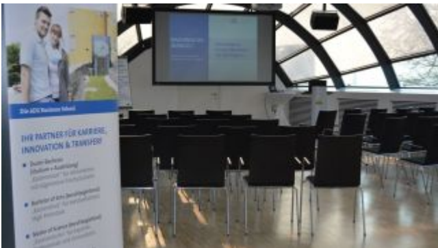
Unternehmerfrühstück im März 2014 auf Schloss Montabaur.